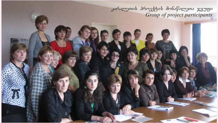
კარალეთის პროექტის მონაწილეთა ჯგუფი Group of project participants

პროექტის საგანმანათლებლო პროგრამაში, ერთიანად, მონაწილეობა მიიღო კარალეთში და 7 მიმდებარე სოფელში მცხოვრებმა 139 ქალმა. გაცემული სერთიფიკატები მოიცავს იმ სემინარების თემების დასახელებას, რაც თითოეულმა მონაწილემ გაიარა.