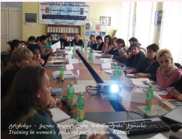
ტრენინგი - ქალთა პოლიტიკური მონაწილეობა, ქუთაისი Training in women's political participation, Kutaisi

☀️ ქალი და მშვიდობა: ფონდმა, მოლაპარაკების საფუძველზე, მცირე გრანტით დააფინანსა დაღუპულ მეომართა დედების კავშირი „არდავიწყება“. პროექტი გულისხმობს ამ საქველმოქმედო ორგანიზაციის განვითარებას ორგანიზაციის ახალგაზრდა წევრების საქმიანობაში ჩართვით და მოსამზადებლად მონაწილეობისთვის სამშვიდობო მოძრაობაში.