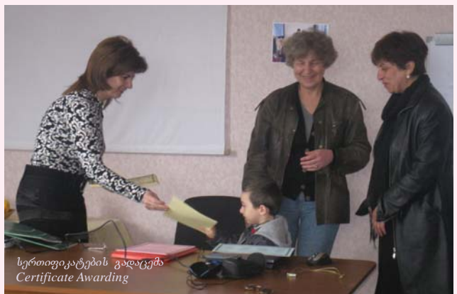
სერთიფიკატების გადაცემა Certificate Awarding