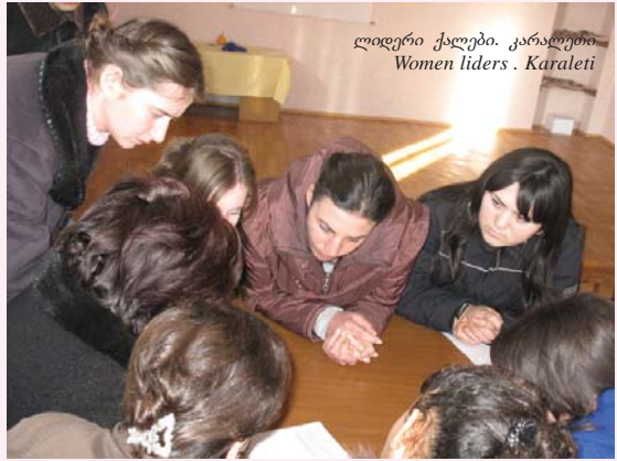
ლიდერი ქალები. კარალეთი Women leaders . Karaleti

რეაბილიტაცია: კარალეთელ ქალებთან პირველივე შეხვედრაზე გახდა ცხადი, რომ ცენტრის მუშაობის ერთი უმთავრეს სამუშაო თემათაგანი უნდა იყოს ძალადობა ოჯახში; ოჯახში ძალადობის დაძლევა უნდა გამხდარიყო, აგრეთვე, იმ ქალთა ორგანიზაციის მიზანი, რომელიც პროექტის ფარგლებში კარალეთში ჩამოყალიბდა. 2008 წელს დაბეჭდილი თემატური პლაკატი, ძალადობისგან დაცვის ეროვნული ქსელის ცხელი ხაზის/კონტაქტების მითითებით, ფართოდ დარიგდა გორისა და ქარელის მუნიციპალიტეტების სოფლებში. ნატო შავლაყაძემ, ქსელის დირექტორმა, ჩაატარა სემინარი ოჯახში ძალადობის თემაზე კარალეთის ცენტრში. სემინარის მსვლელობისას გაცხადდა, რომ ერთ-ერთი მონაწილე ოჯახში ძალადობის მსხვერპლია. ეს იყო ძალზე მწვავე შემთხვევა, ქალი გადაყვანილ იქნა თავშესაფარში, შემდეგ კი თავისი მშობლების სახლში დაბრუნდა. ეს შემთხვევა საშინლად, ქალის თვითმკვლელობით დამთავრდა. ამ ტრაგიკული შემთხვევის შემდეგ ოჯახში ძალადობის შემთხვევებზე რეაგირება კარალეთის ცენტრში უფრო ინტენსიური გახდა. 11 შემთხვევაზე მოხდა რეაგირება ძექის გორის კომიტეტის, საქართველოს ახალგაზრდა იურისტთა ასოციაციის გორის ოფისისა და ორგანიზაციის „ადამიანის უფლებების პრიორიტეტი“ დახმარებით; მათ შორის 9 შემთხვევაში გორის საპატრულო პოლიციაც იყო ჩართული.