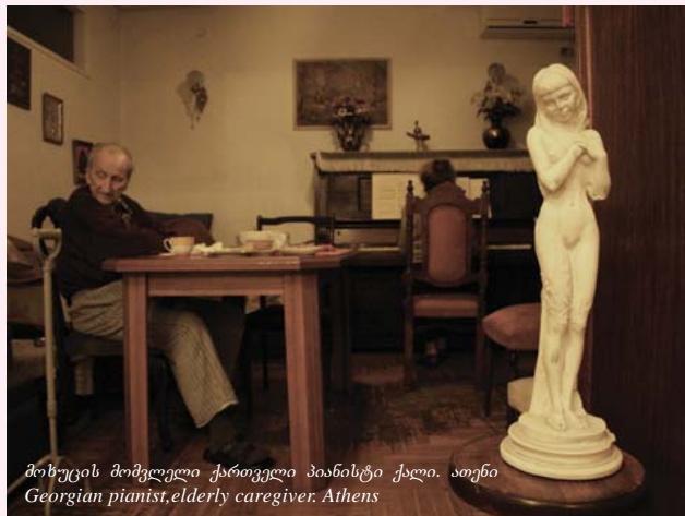
მისუცის მომგვლი ქართველი პიანისტი ქალი. ათენი Georgian pianist, elderly caregiver. Athens

პროექტის მკვლევარებისა და კონსულტანტების მონაწილეობით კვლევის შედეგები წარმოდგენილი იყო PHDS მიერ ორგანიზებულ სხვადასხვა, მათ შორის საერთაშორისო ღონისძიებებზე.