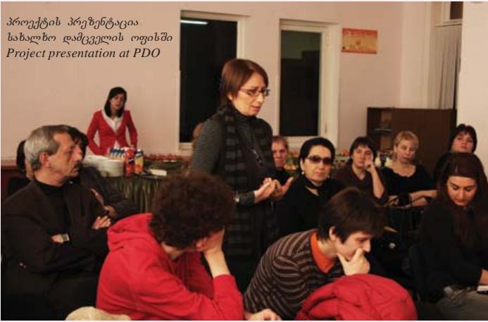
პროექტის პრეზენტაცია სახალხო დამცველის ოფისში Project presentation at PDO

ხელისუფლების წარმომადგენელთა ჩართვა სამოქალაქო საზოგადოების იმ პროგრამებში, რომლებიც ქალთა უფლებებისა და გენდერული თანასწორობის განსახორციელებლად მიმართული; შუამავლობა ადგილობრივ თემებსა და სახელისუფლებო ინსტიტუტებს შორის თემთა რეალური ინტერესების გასათვალისწინებლად.