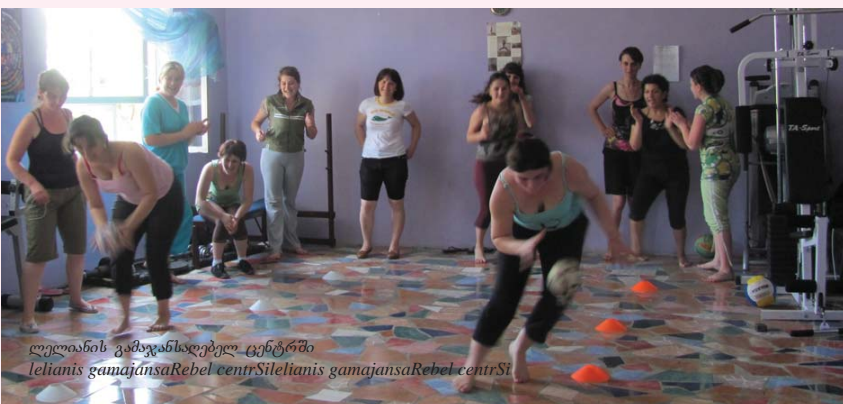
ლელიანის გამაჯანსაღებელ ცენტრში Ieliani's gamajansaRebel centriSileliani's gamajansaRebel centriSi

ფონდმა, OSGF გრანტიდან, თანადაფინანსა კონკურსის „სოფლად მცხოვრებ ქალთა სოციალური და პოლიტიკურად მნიშვნელოვანი საქმიანობა“ სავრანტო ფონდი.