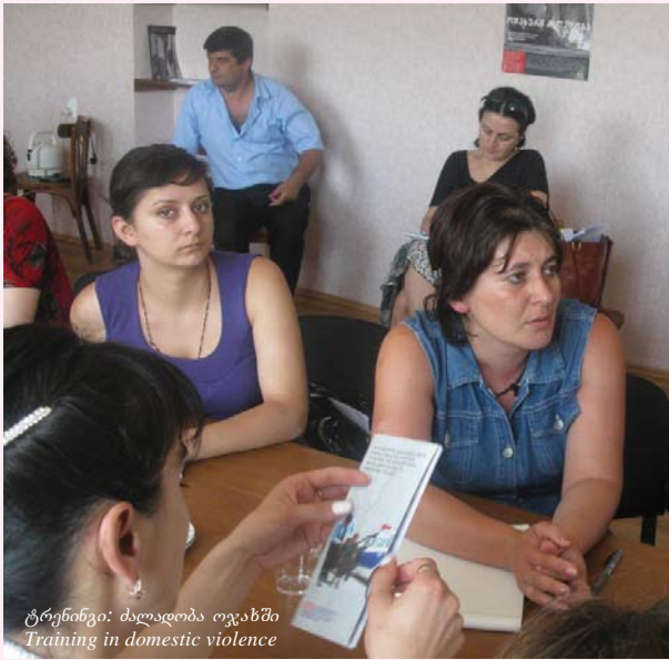
ტრენინგი: ძალადობა ოჯახში Training in domestic violence