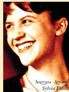
სილვია პლათი Sylvia Plath

ფონდმა, სილვია პლათის რომანის „ზარხუფი“ გამოქვეყნებით, გააგრძელა გამოცემათა სერია ფემინისტური ბიბლიოთეკა . რომანის ქართული თარგმანი და წიგნის წინასიტყვაობა ეკუთვნის ლელა სამნიაშვილს, მწერალს. წიგნის ყდისთვის ფოტო მოგვაწოდა იტალიელმა მხატვარმა ლუსია პორფირიმ.