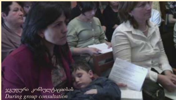
ჯგუფური კონსულტაციისას During group consultation

ფონდმა, სიღარიბის დაძლევის ხელშესაწყობად 2004-2008 წლებში 68 მცირე გრანტი გასცა. ჩვენ ვინარჩუნებთ ურთიერთობას წინა წლების გრანტის მიმღებებთან, ვცდილობთ საქართველოს ქალთა მოძრაობაში ჩავრთოთ მათ შორის ყველაზე აქტიური და ინიციატივიანი ქალები. 2008 წლისთვის უკვე შეიქმნა წინაპირობები პროგრამის შემდგომი ეტაპის, სოფლად მცხოვრებ ქალთა საზოგადოებრივი საქმიანობის ხელშესაწყობის, დასაწყებად. სოფლად ქალთა უფლებების დაცვა უზრუნველყოფილი უნდა იყოს ადგილობრივი ქალთა ჯგუფების/ორგანიზაციების მიერ, მათი თანამშრომლობით ქვეყნის წამყვან და გამოცდილ უფლებადამცავ ორგანიზაციებთან და ადგილობრივ ხელისუფლებასთან.