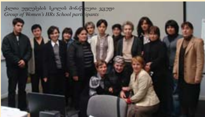
ქალთა უფლებების სკოლის მონაწილეთა ჯგუფი Group of Women's HRs School participants

• ქალთა ცენტრი, ადგილობრივ პოლიციასთან და ძალადობისგან დაცვის ეროვნულ ქსელთან თანამშრომლობით, მოემსახურა ოჯახში ძალადობის მსხვერპლ ქალებს;