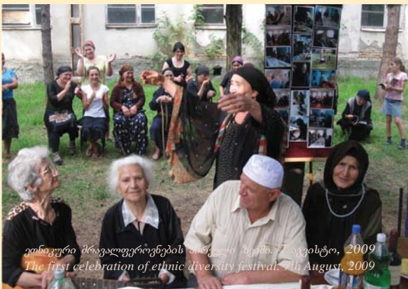
ეთნიკური მრავალფეროვნების საფუძვლიანი ზეპირი ისტორიები, 2009 The first celebration of ethnic diversity festival. In August, 2009