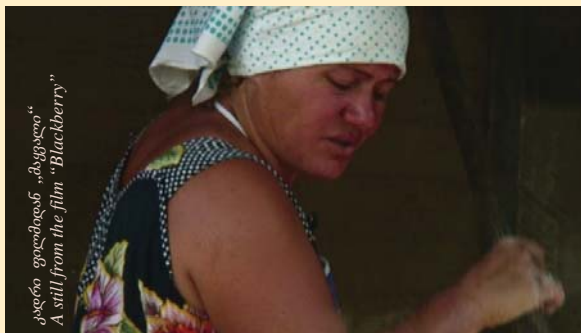
კადრი ფილმიდან „მაყვალი“ A still from the film „Blackberry“

სანიორეს ცენტრის საქმიანობის გამოცდილება აისახა პროექტის დღიურში; ამ გამოცდილებას ფონდი დაეყრდნო მსგავსი პროექტის შემუშავებისას შიდა ქართლში, კონფლიქტის ზონაში განსახორციელებლად.