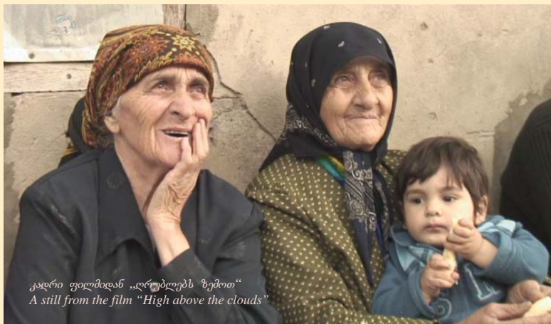
კადრი ფილმიდან „ღრუბლებს ზემოთ“ A still from the film "High above the clouds"

დოკუმენტური კინოს ახალგაზრდა რეჟისორ ქალებთან რამდენიმე საქმიანი შეხვედრის შემდეგ