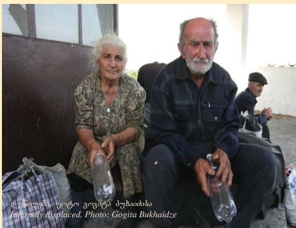
დევნილები, ფოტო გოგიტა ბუხაიძისა Internally displaced. Photo: Gogita Bukhaidze

2008 წლის აგვისტოს ომმა დიდი გავლენა მოახდინა საქართველოს მოსახლეობაზე, ისევე, როგორც სამოქალაქო ორგანიზაციების, მათ შორის ფონდის ტასო საქმიანობაზე. იგულისხმება, უპირველეს ყოვლისა, ჰუმანიტარული საქმიანობა გადაუდებელი დახმარების გასაწევად დევნილი მოსახლეობისთვის, მაგრამ აგრეთვე – მნიშვნელოვანი ცვლილებები ფონდის საქმიანობის დაგეგმარებაში. 2008 წლის ბოლოს ფონდმა, 2009-2011 წლებისთვის, შეიმუშავა ახალი სტრატეგიული გეგმა, რომელშიც, უპირატესად, კონფლიქტებით დაზარალებულ და იძულებით გადაადგილებულ ქალთათვის განკუთვნილი ადამიანის უფლებების ადვოკატირებისა და სოციალური მობილიზაციის