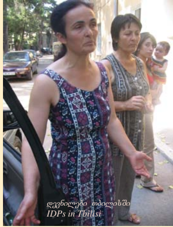
დევნილები თბილისში IDPs in Tbilisi

ავვისტოს დამეს კონფლიქტი ომში გადაიზარდა. 11 ავვისტოს თბილისში უკვე ათასობით იძულებით გადაადგილებული ოჯახი იყო დასაბინავებელი. ომის პირველ დღეებში, ისევე, როგორც სამოქალაქო საზოგადოების სხვა ორგანიზაციები, ვუკავშირდებოდით კოლეგებს, ვაწვდიდით ინფორმაციას, ვიღებდით და ვავრცელებდით მხარდაჭერის წერილებს. 11 ავვისტოდან დაიწყო მუშაობა იძულებით გადაადგილებულთა დასახმარებლად, ვაწვდიდით საკვებს, ჰიგიენის პროდუქტებს, წამლებს. ჩვენ ვმოქმედებდით თანამშრომლობით ფონდთან „ღია საზოგადოება – საქართველო“, რომელმაც მაშინ დევნილი მოსახლეობის დახმარების ერთ-ერთი ყველაზე