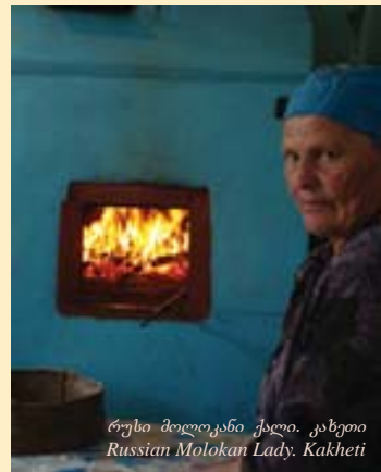
რუსი მოლოკანი ქალი. კახეთი Russian Molokan Lady, Kakheti