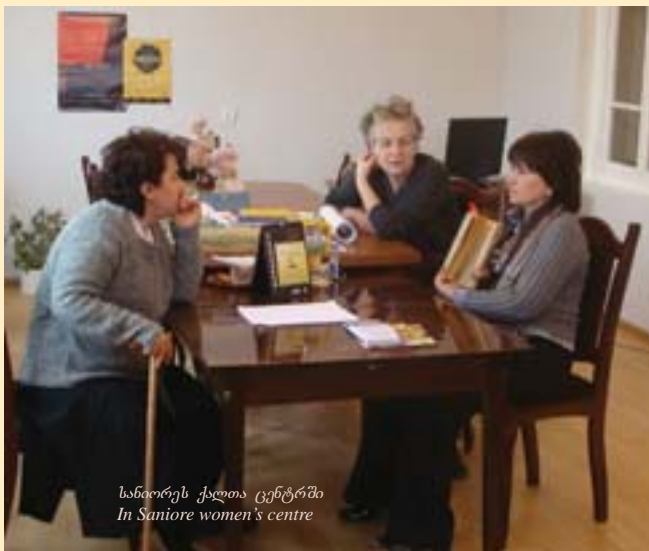
სანიორეს ქალთა ცენტრში In Saniore women's centre

2008 წლის 1 აგვისტოს დაიწყო საპილოტე პროექტი „სათემო ცენტრი საზოგადოებრივი პასუხისმგებლობისთვის დემოკრატიზაციის პროცესში“. პროექტის მთავარი მიზანი იყო ქალთა მობილიზება სოფლად გენდერული თანასწორობისა და სამართლიანობის მისაღწევად