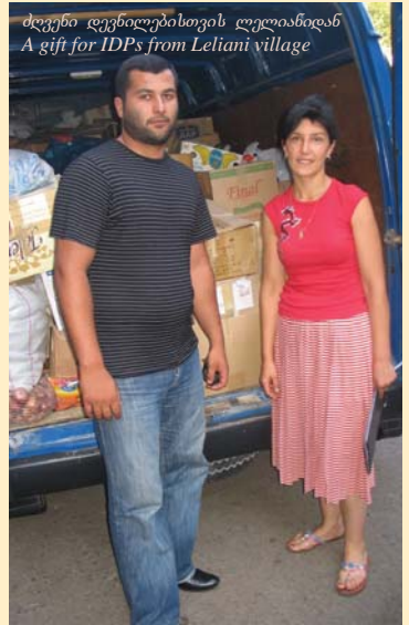
ძვენი დევნილებისთვის ლელიანიდან A gift for IDPs from Leliani village

„ადამიანის სიცოცხლე, ისევე, როგორც მშვიდობა, ადამიანის სიცოცხლისა და უსაფრთხოების პირობა, უმაღლესი ფასეულობაა; ცხადია, რომ მოვლენები სცდება რუსულ-ქართული კონფლიქტის ჩარჩოს და საერთაშორისო ხასიათს იძენს, მიმართვამ არ უნდა შეუწყოს ხელი გლობალური კონფორმაციის ესკალაციას; ჩვენი ქმედებები მიმართული უნდა იყოს ომის მსხვერპლთა სასარგებლოდ, მათი უკეთესი ინტერესების გათვალისწინებით“.