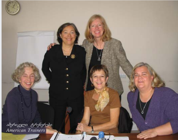
ამერიკელი ტრენერები American Trainers

პოლიციის ოფიცრებისთვის; საგანმანათლებლო პროგრამის შემუშავება იუსტიციის უმაღლესი სკოლისთვის“. ოქტომბერში გაიმართა სამი 2-დღიანი ტრენინგი ოჯახში ძალადობასთან ბრძოლის კონკრეტულ საკითხებზე, ასევე – კოორდინირებულ თანამშრომლობაზე სახელმწიფო და სამოქალაქო საზოგადოების ორგანიზაციებს შორის ოჯახში ძალადობის დასაძლევად. ტრენინგებს იუსტიციის უმაღლესმა სკოლამ უმასპინძლა. ტრენინგებს, ერთიანად, 70 მონაწილე დაესწრო: საქართველოს სხვადასხვა რეგიონებიდან ჩამოსული და თბილისში მომუშავე მოსამართლეები, პოლიციის ოფიცრები და პროკურორები. ტრენინგები უსასყიდლოდ ჩაატარეს ამერიკელმა პროფესიონალებმა: ქალთა უფლებების დამცველებმა ორგანიზაციიდან ადამიანის უფლებების მინესოტელი ადვოკატები და მოსამართლე ქალებმა.