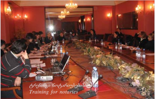
ტრენინგი ნოტარიუსებისთვის Training for notaries

ფონდმა ტასო გააგრძელა თანამშრომლობა ასოციაციასთან კანონი ხალხისათვის და მხარი დაუჭირა 2006 წელს დაფინანსებული წარმატებული პროექტის „საქორწინო ხელშეკრულება“ გაგრძელებას. 2007 წელს, პროექტის ფარგლებში, ასოციაციამ, საქორწინო ხელშეკრულების მის მიერ შემუშავებული და იუსტიციის სამინისტროსგან დამტკიცებული ფორმების და პროცედურების შესასწავლად, სემინარები ჩაუტარა ნოტარიუსებს და მოქალაქეთა რეგისტრაციის დაწესებულებების თანამშრომლებს. ოჯახში ძალადობის საკითხებს მიძღვნილ საგანგებო გადაცემაში, რადიო „იმედის“ ეთერში, ფონდის ტასო გენერალურმა დირექტორმა, ძალადობისგან დაცვის ეროვნული ქსელის ლი-