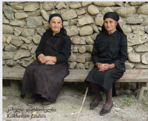
კახელი დარბაისილები Kakhetian Ladies

☀ 2007 ფონდმა მოამზადა, დაბეჭდა და გაავრცელა საინფორმაციო პლაკატი აივ-შიდსის შესახებ.