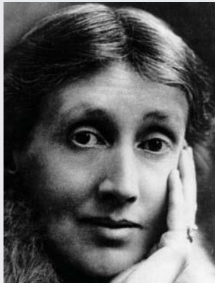
ვირჯინია ვულფი Virginia Woolf

☉ 2007 წელს ფონდმა ტასო წამოიწყო გამოცემათა ახალი სერია „ფემინისტური ბიბლიოთეკა“. სერია მოწოდებულია ქალთა შემოქმედების, ფემინისტური აზროვნების პოპულარიზაციისთვის და გენდერული/