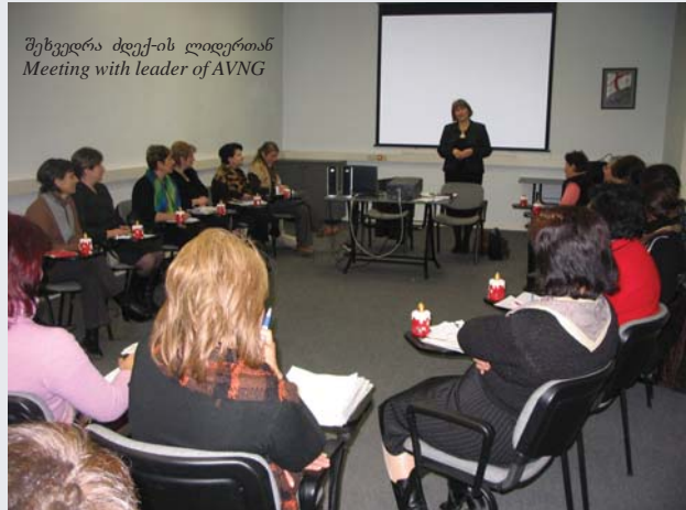
შეხვედრა ძღვეთის ლიდერთან Meeting with leader of AVNG

არაჩვეულებრივად სასიამოვნო ატმოსფეროში ნამდვილ ზეიმად აქცია სოფლელ ქალთა კრება, რომლის ყველაზე საინტერესო ნაწილი, გულწრფელი, ხალისიანი, და, ამავე დროს, უაღრესად საქმიანი გამოსვლებით, მათ თავად ჩაატარეს.