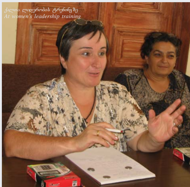
ქალთა ლიდერობის ტრენინგზე At women's leadership training

ლებიდან ჩამოსულმა 80-მდე გოგონამ მიიღო მონაწილეობა. ბანაკის პროგრამა ითვალისწინებდა გოგონათა თვითმეფასების ამაღლებას, ლიდერობის უნარ-ჩვევების შეთვისებასა და სწავლებას ქალთა მიმართ ძალადობის დასაძლევად.