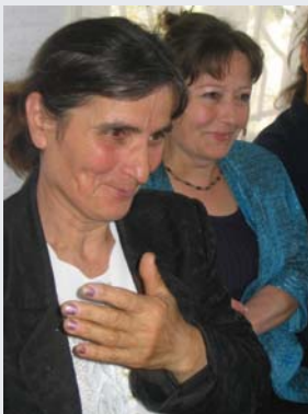
Our partners. Vardisubani ვარდისუბნელი ქალები